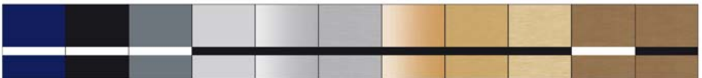
P209 dunkelblau-weiss, P210 schwarz-weiss, P271 grau-weiss, P207 alu matt-schwarz, P281 silbergloss-schwarz, P291 silbergeb.-schwarz, P282 goldgloss-schwarz, P292 gold geb.-schwarz, P297 euro. gold geb. schwarz, P293 bronze geb.-weiss, P294 bronze geb.-schwarz