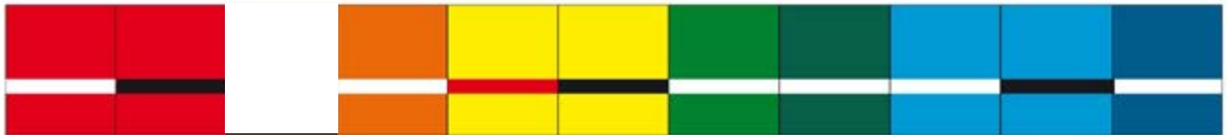
P248 rot-weiss, P249 rot-schwarz, P277 orange-weiss, P234 gelb-rot, P235 gelb-schwarz, P205 apfelgrün-weiss, P259 waldgrün-weiss, P233 hellblau-weiss, P227 hellblau-schwarz, P226 blau-weiss